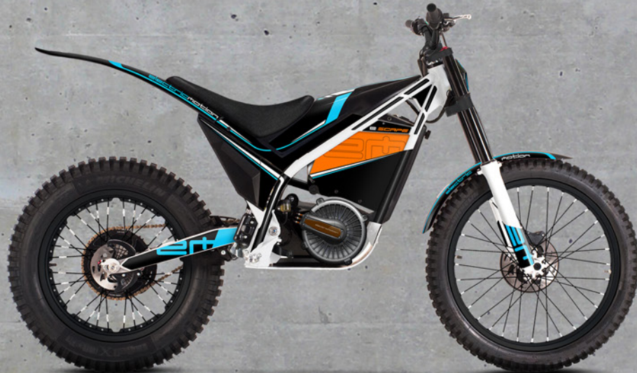
e ESCAPE SPORT