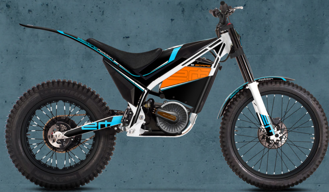
e SCAPE SPORT